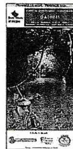
CARTE des PROMENADES Prix de vente: 6 €